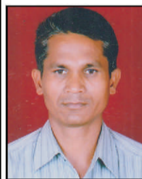
होली की हार्दिक शुभकामनाएं